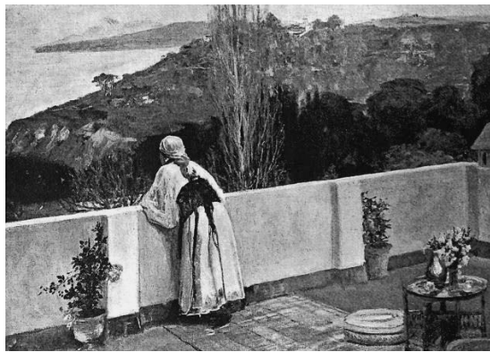
図2 John Lavery, Evening

ここで一先ず、西欧絵画におけるオリエンタリストらの足跡を辿ってみよう。よく知られている通り、フランス人画家のドラクロワ(1798—1863)やドラロシェ(1797—1866)が一八三〇年代にモロッコを旅し画におさめて以来、北アフリカは十九世紀を通して芸術家の巡礼の場所であった。世紀半ば頃には、フランス人のジェローム(1824—1904)やイギリス人のルイス(1805—1876)などのオリエンタリストが東地中海地域を好んだ。そして、一八八〇年代には、イギリスの画家たちによって、タンジールが再び発見される。初期のオリエンタリストたちが、東洋の生活様式や、寺院や聖殿での儀式に注目していたのに対して、レーヴァリーの同時代人たちは、その土地の環境に反応した。タンジールには、イギリスにはない、澄み切った空の強い光とその下での鮮やかな色、そして、石の厚板のような白い建築物の中で見出される影があった。