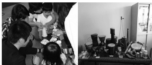
紙コップで「クイーカ」づくり (2016年)