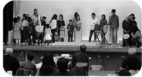
写真2 左：第2回多文化共生フェスタのプログラム／右：「まち協バンド」の演奏の様子と、参加者がラテン・アフリカ音楽を体験する様子（かんちゃん通信第14号より）

ある伝統音楽に限定しない、演奏者自らが選択した音楽であり地域の人々の共同体が大切にしている音楽であると言える。「コミュニティミュージック」の発展には、コミュニティ同士の音楽体験の共有が不可欠であり、この音楽活動では参加者が「マイミュージック」を発信する場所、そして新たな音楽に出会うことで、相互に共感し共生する関係性を築いているのである。さらに、地元住民のコミュニティだけでなく、安土学区まちづくり協議会や公益社団法人滋賀県国際協会、県内外からの大学生ボランティア、友の会等の多様なコミュニティを結ぶことで事業を実施している点は、組織の活性化を図る理想的な連携体制であると言える。