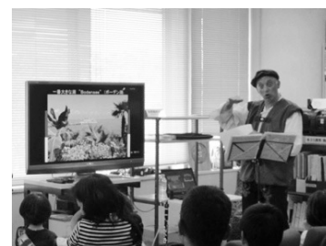
「カポエイラ」のダンスやピリンバウなどブラジルの打楽器を用いた活動 (2017年)