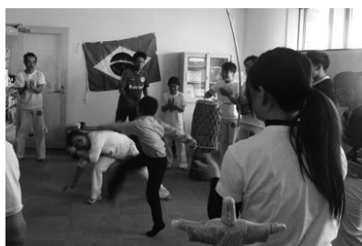
地元のドイツ人音楽家による講座 (2015年)

音楽を通じた取組みとして、当協会主催のラ・フォル・ジュルネびわ湖キッズプログラム「子ども多文化体験プログラム」および「多文化子ども広場」を紹介したい。まず、「子ども多文化体験プログラム」は、ラ・フォル・ジュルネびわ湖 12) のイベントとして滋賀県内在住の外国人講師をゲストとして招き、未就学児および小学生を対象に、多様な文化・